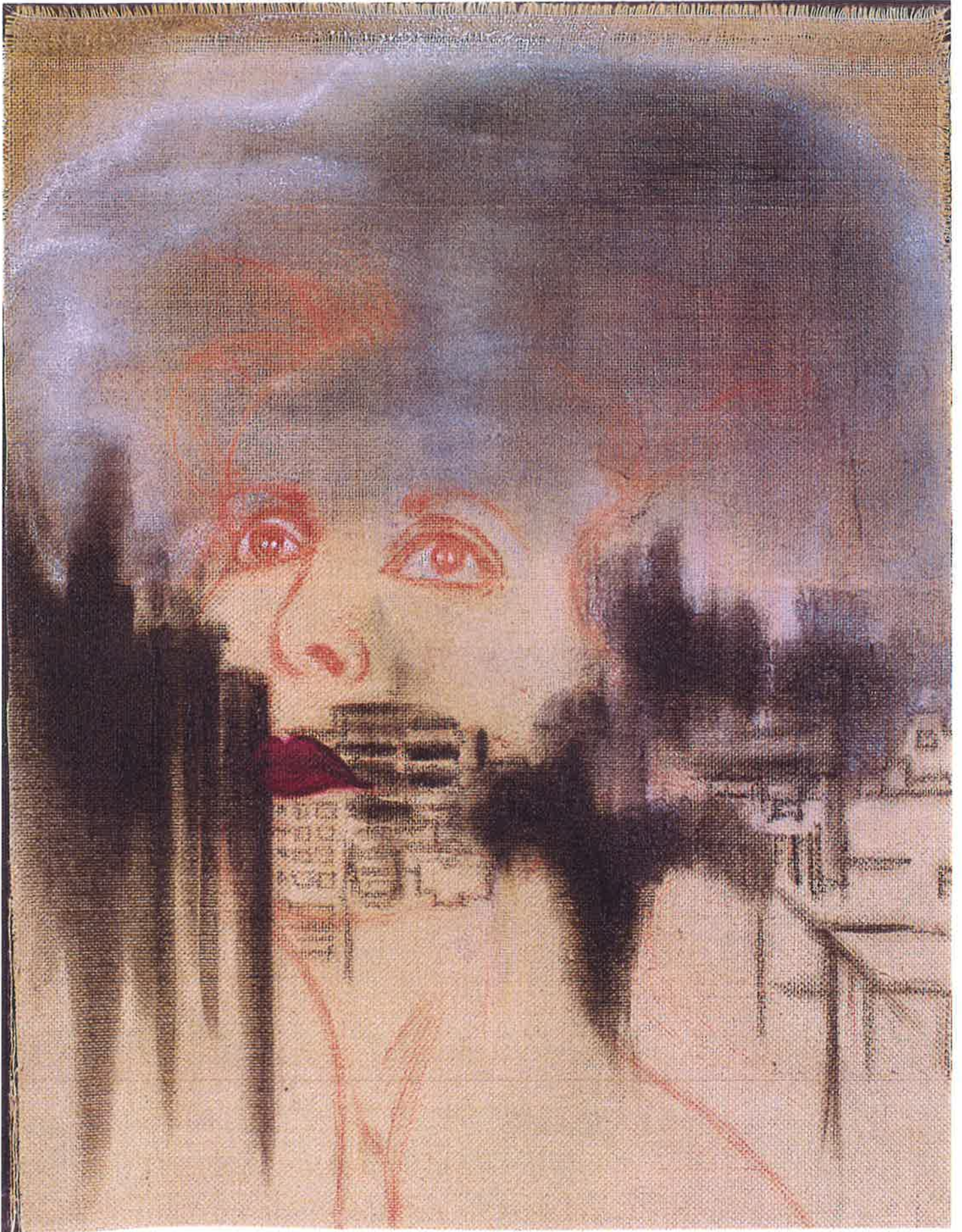
Huile et pastel sur toile de lin marouflée sur papier.