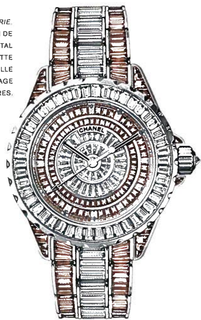
CHANEL HAUTE JOAILLERIE. MONTRE DE 38 MM SERTIE DE DIAMANTS POUR UN POIDS TOTAL DE 12,5 GRAMMES. CADRAN ENTIEREMENT SERTI EN DIAMANT TAILLE BAGUETTE. MOUVEMENT QUARTZ À REMONTAGE MANUEL À 12 EXEMPLAIRES.

ces premières montres pour dames resteront pratiquement inchangés, transformés et mis au goût du jour, jusqu'à notre époque. En premier lieu, la créativité, qui commence avec les pièces uniques, mais s'élargit clairement aux appartenant plus au monde de la joaillerie qu'à celui de l'horlogerie. Et qui mesure la mesure du temps pour créer autour des cadrans de leurs montres des ordinares d'or et de pierres précieuses, avec parfois des éléments décoratifs.