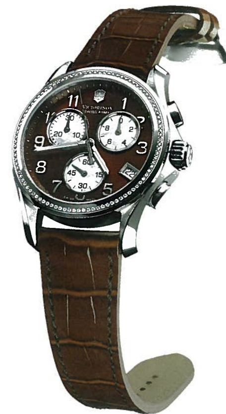
VICTORINOX SWISS ARMY CHRONO CLASSIC LADY. BOÎTIER ACIER

En abordant l'univers féminin, on ne peut s'empêcher de penser également à la mode, surtout lorsqu'elle adopte les paramètres de l'horlogerie. On ne peut qu'admirer la manière dont la Maison Louis Vuitton a su rendre délicieusement léger et féminin son modèle Tambour, à l'origine un puissant garde-temps masculin, ou imprimer sur les cadrans, les boucles ou les bracelets son célèbre monogramme reconnaissable entre tous. Tout aussi remarquable est la réussite de Chanel d'animer un matériau froid et technologique comme la céramique high-tech, l'habillant de noir, de blanc, d'or et de pierres précieuses jusqu'à en faire l'une des matières les plus tendance de l'horlogerie féminine contemporaine. En réalité, ce qu'ont réussi à faire les stylistes dans le monde de l'horlogerie – et surtout de l'horlogerie féminine –, a été d'apporter une nouvelle vitalité dans ce secteur, que ce soit au niveau du haut de gamme ou dans l'interpré-