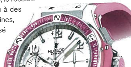
HUBLOT BIG BANG STEEL TUTTI FRUTTI ROSE. BOÎTIER «BIG BANG» 41 MM EN ACIER POLI, LUNETTE SERTIE DE 48 SAPHIRS BAGUETTES ROSES AVEC SIX VIS EN TITANE.

Cependant, au cours de ces dernières années, s'est formée également une clientèle de femmes passionnées de «belle horlogerie» au-delà de la préciosité, et donc d'horlogerie mécanique. Patek Philippe a répondu par exemple à cette nouvelle demande avec son nouveau modèle Ladies First Chronographe, imposant son sceau sur un type de produit jusqu'ici réservé aux hommes: chronographe à roue à colonnes, fond ouvert sur le mouvement manufacturé, remontage manuel, 65 heures de réserve de marche et caractéristiques chronométriques. Le tout avec l'apparence gracieuse et les proportions d'un modèle résolument féminin – jusqu'au cadran serti de diamants – et à l'esthétique inspirée de la période Art Déco. Certainement pas un cas isolé, mais seulement une importante prise de position sur un thème, celui de l'horlogerie mécanique de qualité au féminin, représenté depuis longtemps par des exemples très intéressants issus de la période pré-quartz de l'horlogerie. On citera notamment les très raffinés modèles animés par le célèbre Calibre 101 de Jaeger-LeCoultre – le plus petit mécanisme d'horlogerie jamais réalisé, formé de 98 composants pour un poids total d'à peine un gramme et une taille de 14x4,8x3,4 mm – ou les extraordinaires déclinaisons du modèle Reine de Naples de Breguet. Voire, dans certains cas, le recours à des grandes complications ou à des tourbillons sur des pièces féminines, comme l'ont parfaitement réalisé Audemars Piguet, Blancpain ou encore une fois Breguet.