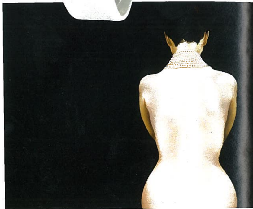
«MOON» DE L'ARTISTE MOUNA REBEIZ, HUILE SUR TOILE — HTTP://MOUNAREBEIZ.COM