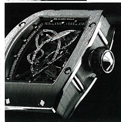
RICHARD MILLE RM 019. CADRAN ENTIÈREMENT AJOURÉ DOMINÉ PAR UN NŒUD CELTIQUE SERTI DE DIAMANTS. BOÎTIER EN OR BLANC 18 CARATS COURONNE AVEC COLLIER EN ALCRYN. FOND SAPHIR TRANSPARENT. MOUVEMENT MÉCANIQUE À REMONTAGE MANUEL AVEC TOURBILLON. PLATINE EN ONYX NOIR. RÉSERVE DE MARCHÉ DE 50 HEURES. BRACELET ALLIGATOR NOIR.

En parlant d'orientation avant tout masculine, on peut rappeler les belles métamorphoses de certains modèles qui, bénéficiant notamment de leur statut d'icône de l'horlogerie, ont réussi à s'adapter également aux poignets des dames – le cas échéant avec les aménagements de rigueur, telles qu'une réduction de la taille ou l'utilisation d'or, de nacre ou de diamants dans une démarche fortement décorative. C'est le cas de montres emblématiques comme la Royal Oak d'Audemars Piguet, la Datejust de Rolex, la Nautilus de Patek Philippe ou encore de nombreux modèles de Cartier conçus initialement en version masculine, mais déclinés avec bonheur pour les femmes.