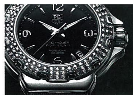
RALPH LAUREN STIRRUP PAVÉ DE DIAMANTS. BOÎTIER OR BLANC EN ÉTRIER SERTI DE 348 DIAMANTS, COURONNE SERTIE. MOUVEMENT MÉCANIQUE À REMONTAGE MANUEL MANUFACTURE JAEGER-LECOULTRE POUR RALPH LAUREN. RÉSERVE DE MARCHÉ DE 70 HEURES. BRACELET ALLIGATOR BLANC DOUBLÉ D'ALSVEL NOIR, BOUCLE DÉPLOYANTE OR BLANC.